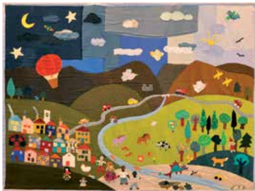
Arazzo di Lauren Moreira ed Emanuele Bertossi